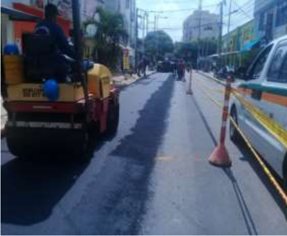
POIR 6.2 SECTOR LA FERIA

ubicada en el lote el vivero en Bucaramanga y la reposición de redes de la conducción Florida-El Carmen, en Floridablanca. Estos contratos se terminaran de ejecutar en el segundo semestre de la presente vigencia.