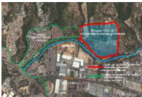
LOCALIZACIÓN DEL PROYECTO.

El proyecto para la ampliación del perímetro de servicio de acueducto se encuentra localizado en el sector norte del casco urbano del Municipio de Girón, sobre la margen izquierda del Río de Oro. Los Barrios localizados en este sector son los Siguietes: La Esmeralda, Palenque, San Antonio de Carrizal y la Zona Industrial de Chimitá