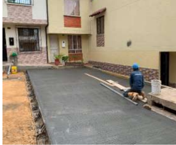
POIR 6.2 SECTOR LA PEDREGOZA