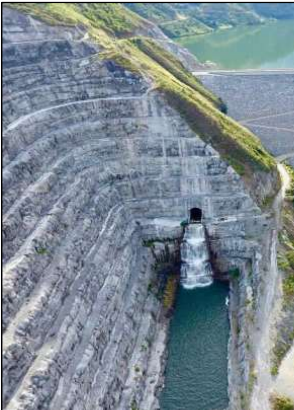
Panorámica del Embalse de Bucaramanga

A la fecha el amb S.A. E.S.P. realiza la operación y mantenimiento de las obras construidas.