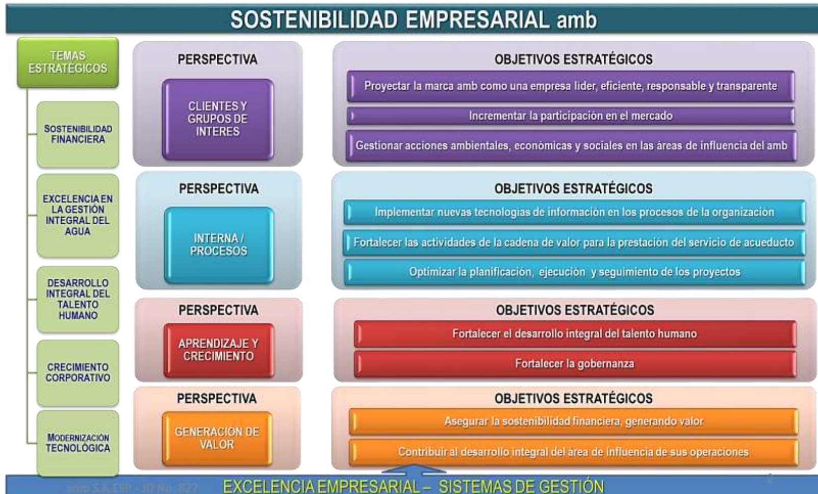
Grafica 1. Mapa Estratégico

El mapa estratégico traduce la estrategia del amb por medio de un diagrama de relaciones causa y efecto entre los objetivos estratégicos definidos en cuatro perspectivas, en los que su interacción genera al final valor para los grupos de interés.