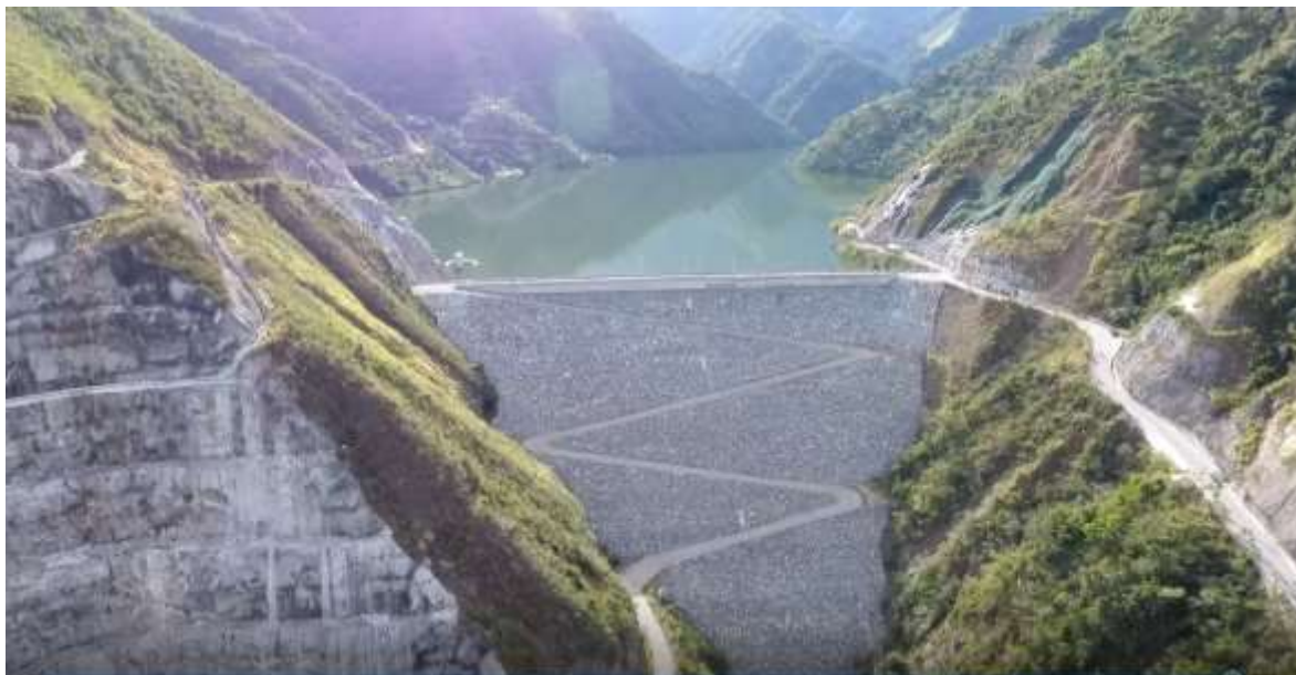
Panorámica del Embalse de Bucaramanga.

A la fecha el amb S.A. E.S.P. realiza la operación y mantenimiento de las obras ejecutadas.