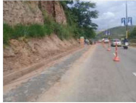
CONSTRUCCION LINEA DE CONDUCCION TANQUE SAN JUAN- AUTOPISTA GIRON