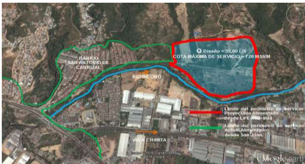
LOCALIZACION DEL PROYECTO. FUENTE : GOOGLE EARTH

El proyecto para la ampliación del perímetro de servicio de acueducto se encuentra localizado en el sector norte del casco urbano del Municipio de Girón, sobre la margen izquierda del Río de Oro. Los Barrios localizados en este sector son los Sigüientes: La Esmeralda, Palenque, San Antonio de Carrizal y la Zona Industrial de Chimitá.