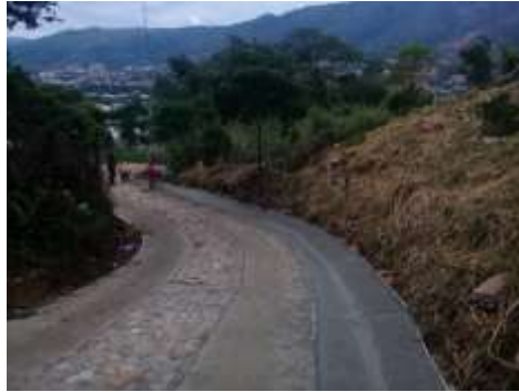
VIA DE ACCESO AL TANQUE DE ALMACENAMIENTO LA ESMERALADA