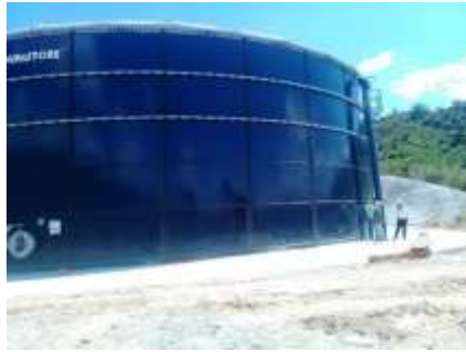
TANQUE DE ALMACENAMIENTO LA ESMERALADA