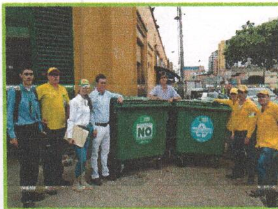
Fotografía 1. Entrega de Contenedores Plaza San Francisco.