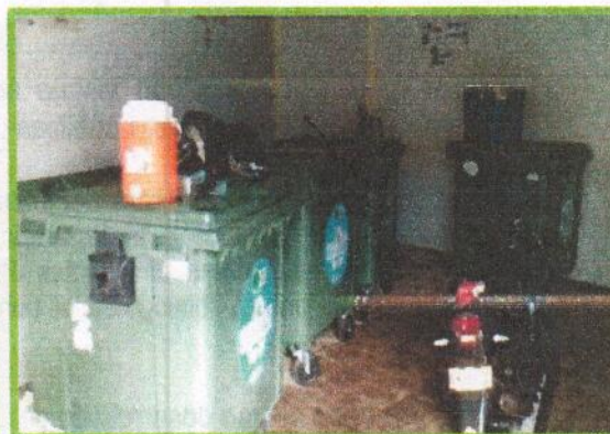
Fotografía 3. Cuarto de Aseo Plaza San Francisco, con cuatro contenedores ubicados.