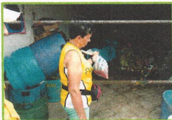
Fotografía 2. Cuarto de Aseo Plaza San Francisco, antes de ubicar los contenedores.