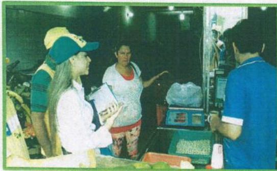
Fotografía 4. Sensibilización al Interior de la Plaza San Francisco.