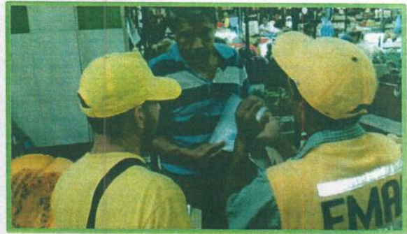
Fotografía 5. Sensibilización en locales ubicados al exterior de la Plaza San Francisco.

¿Qué acciones se vienen desarrollando para el manejo de los residuos sólidos en las inmediaciones de la plaza de mercado Guarín?