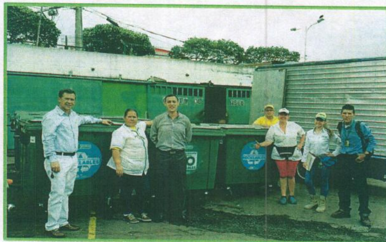
Fotografía 6. Entrega de Contenedores al interior de la Plaza Guarín.

Carrera 33ª con calle 32, esquina plaza de mercado: 2 contenedores Carrera 33 con calle 33, esquina plaza de mercado: 2 contenedores Interior del Cuarto de Aseo de la plaza: 6 contenedores.