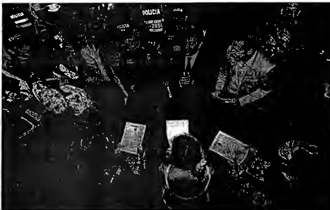
143 menores de edad fueron sorprendidos en bares, tabernas y otros establecimientos a avanzadas horas de la noche Del viernes y de la madrugada de ayer, luego de un operativo impulsado por las autoridades municipales. Domingo 4 de Marzo de 2013.

* El decreto también advierte fuertes sanciones económicas y de funcionamiento a los establecimientos comerciales que sean sorprendidos vendiendo licores a los menores de edad.