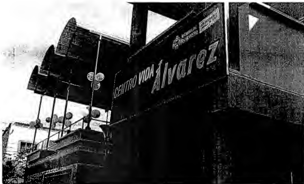
Infraestructura del Centro Vida Alvarez

Igualmente se cuenta con un equipo interdisciplinario de apoyo a las Comisarias, que practican el Toque de Queda, donde se orienta a los menores del peligro en la calle y de la mejor utilización del tiempo libre.