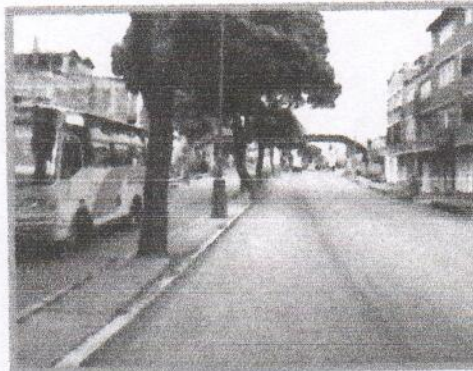
Recuperación separador carrera 9