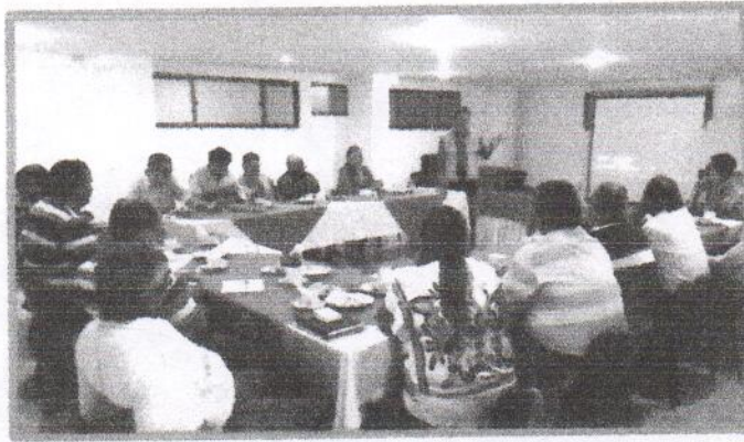
Divulgación de Horarios y Frecuencias a la representantes de la Comunidad

realizado reuniones con los presidentes de junta de esta comunidad para divulgar los horarios de recolección y tener en cuenta las problemáticas de estos barrios, con el fin de que en común acuerdo se haga buen uso del servicio, actualmente se realizan capacitaciones cuando se solicitan por parte de los usuarios del servicio de aseo.