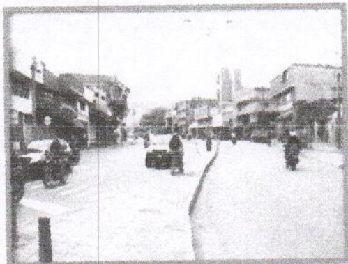
Recuperación avenida Quebradaseca

Retorno a la Cárcel de la Mujer, Y de la Feria, Carrera 14 Mercado de las Pulgas, Calle 20 Entre carrera 14 y 15, Calle 6 Entre Carrera 21 y 22, Calle 5 con Carrera 21, Calle 3 con Carrera 16 Vía Matanza, Calle 5 con Carrera 16ª, Vía Bavaria, Barrio Café Madrid Antigua Cancha, Separador Calle 45, Separador Carrera 9, Separador carrera 15, Separador Avenida Quebradaseca y Separador Bulevar Santander.